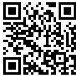
新生应征入伍数据填报二维码

因应征入伍不能按时到校报到注册的新生，请于9月10日前扫描下方二维码进行应征入伍的数据填报。